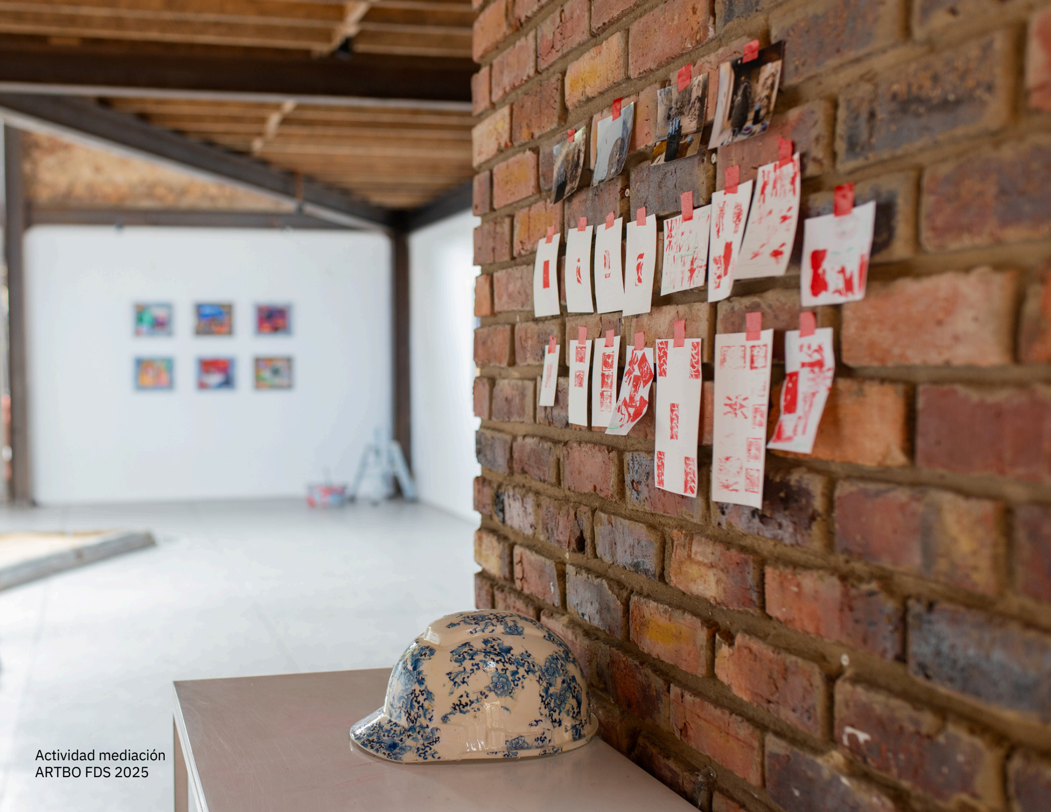
Actividad mediación ARTBO FDS 2025