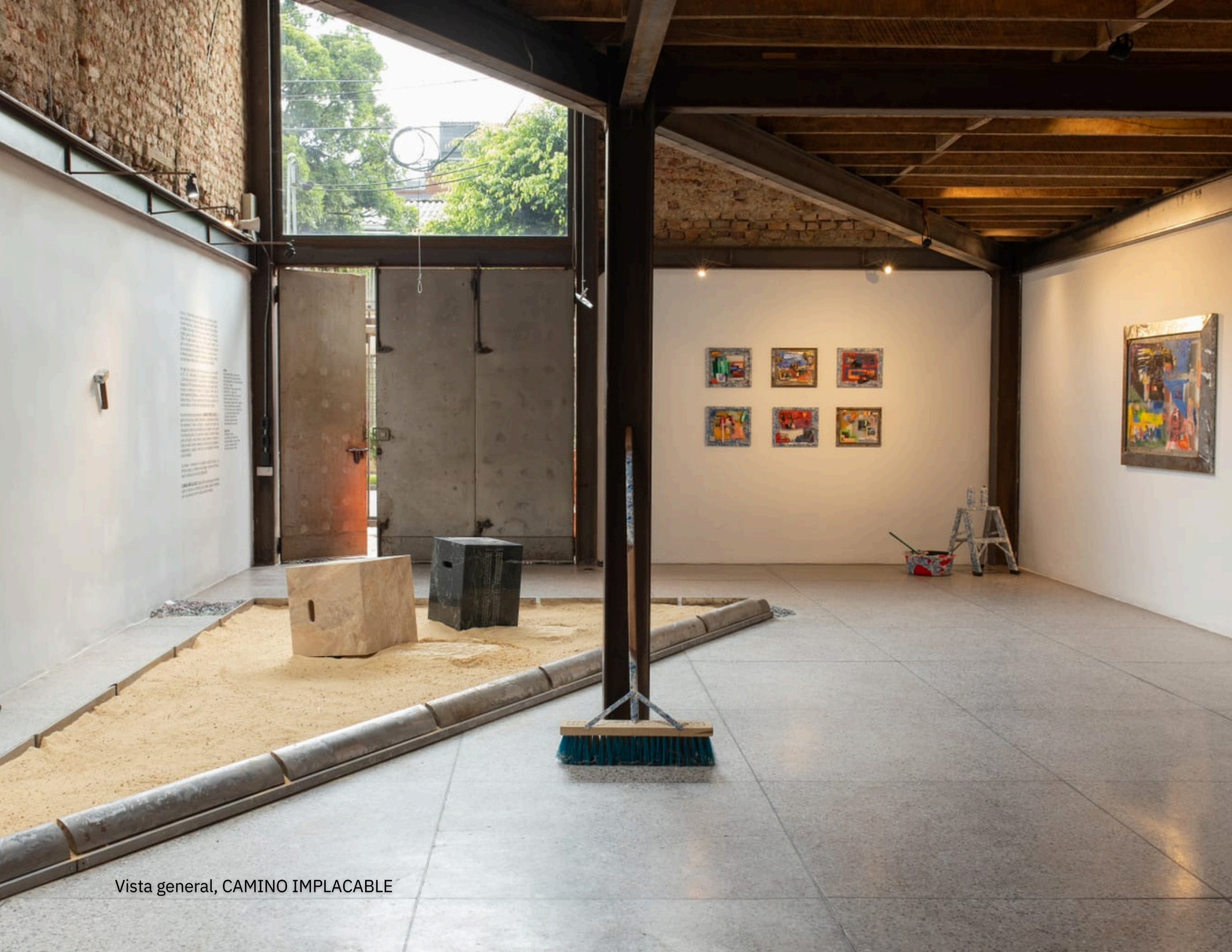
Vista general, CAMINO IMPLACABLE