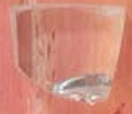
Detalle | Detail