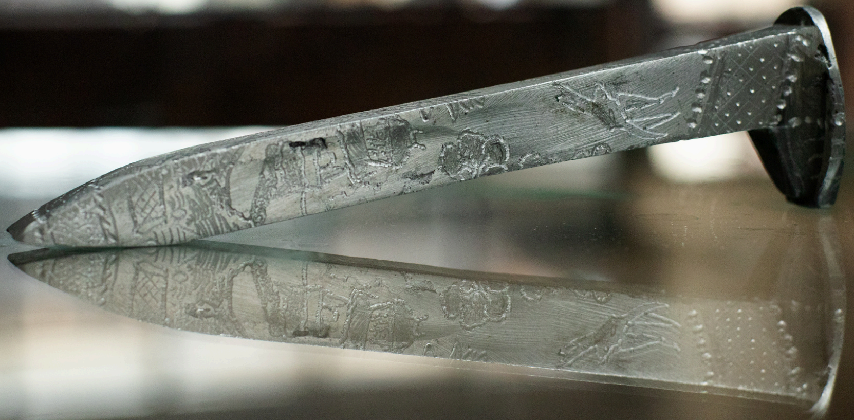
Sin título 2025 Clavo de metal intervenido 3cm x 16cm