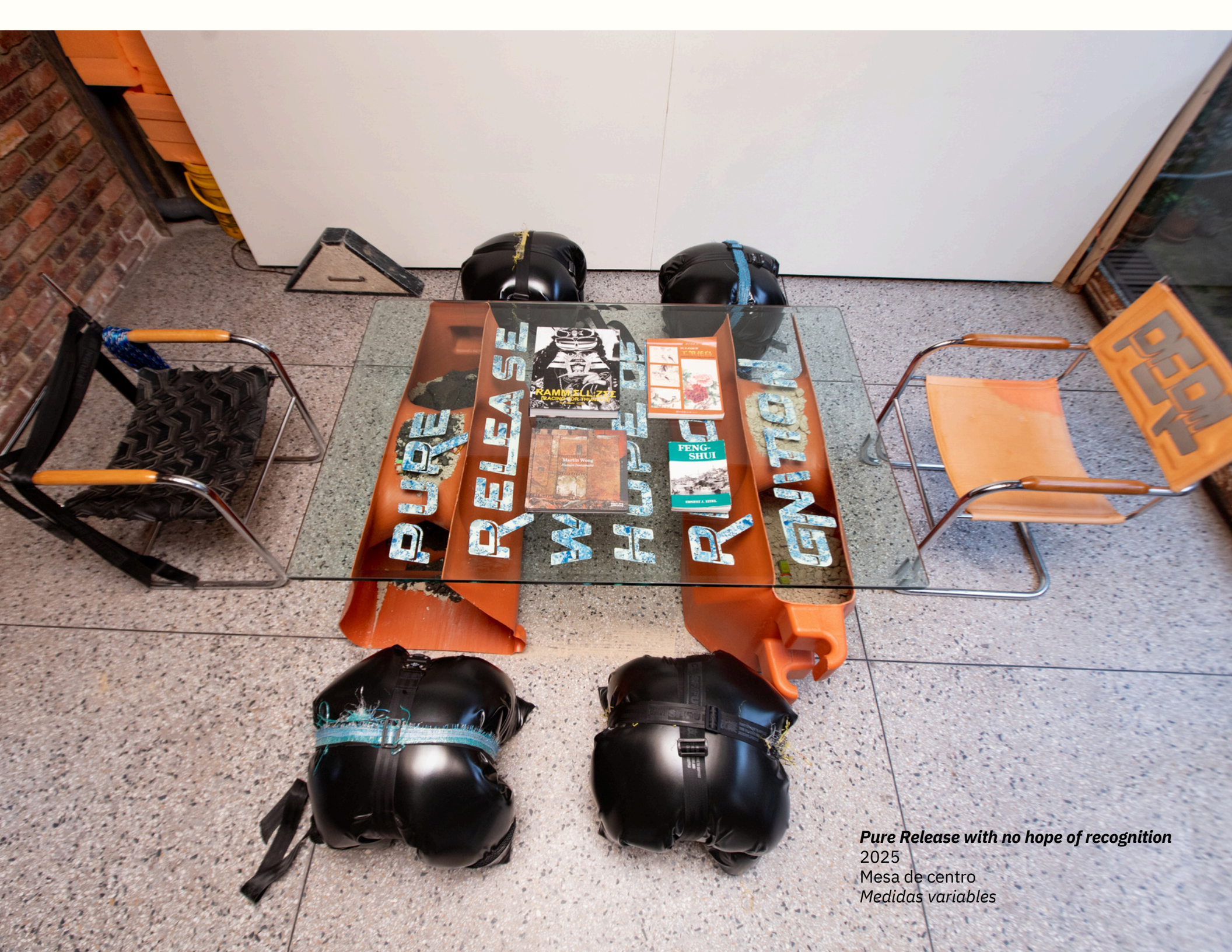
Pure Release with no hope of recognition 2025 Mesa de centro Medidas variables