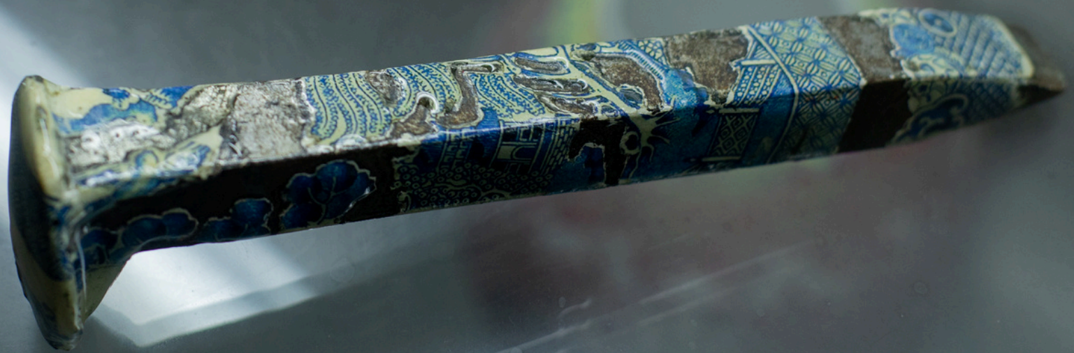
Sin título 2025 Clavo de metal intervenido 3cm x 16cm