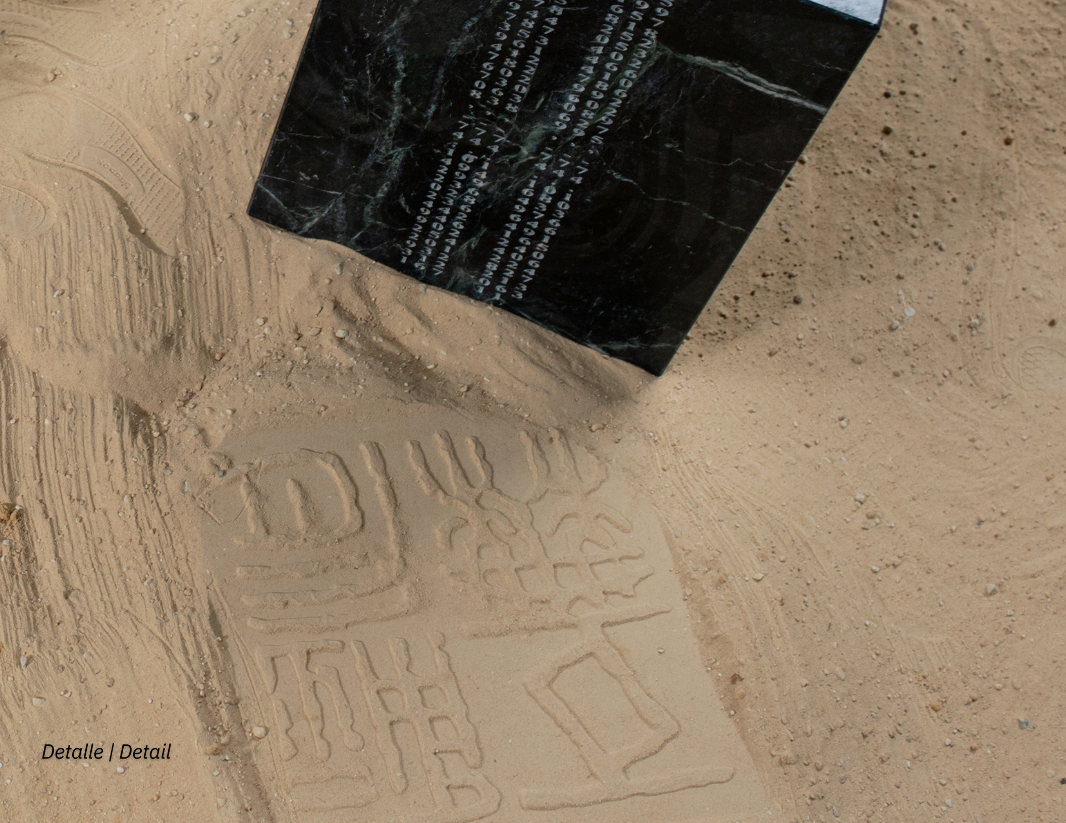
Detalle | Detail