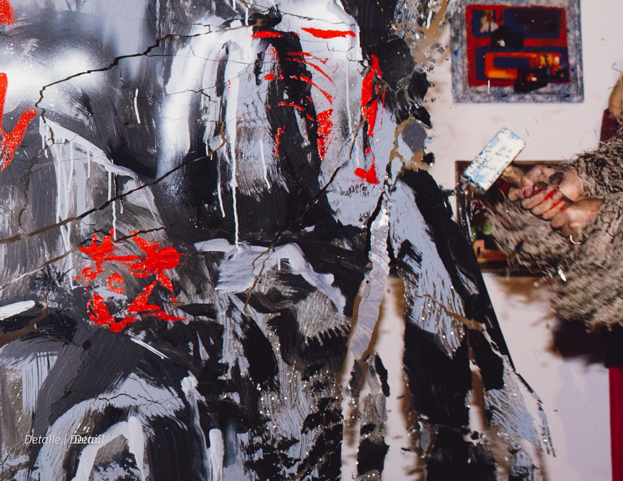
Detalle / Detaill