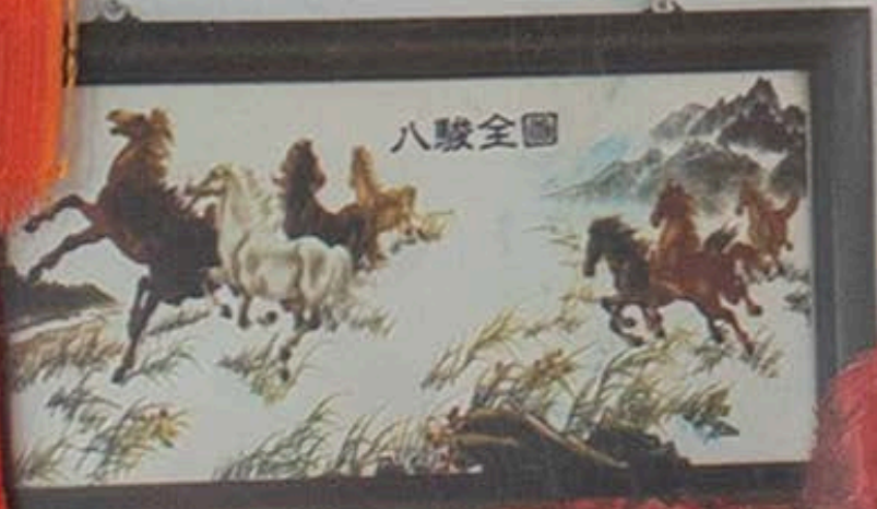
Detalle | Detail