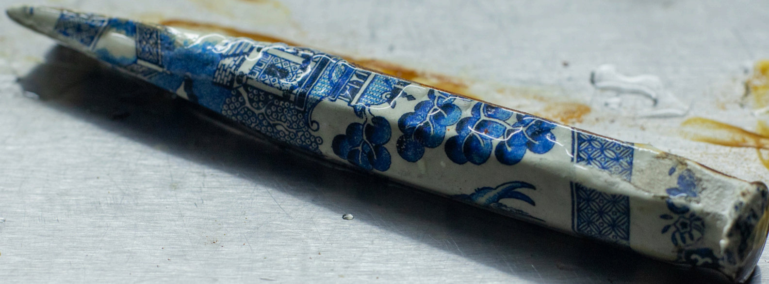
Sin título 2025 Clavo de metal intervenido 2,5 cm x 16,5 cm