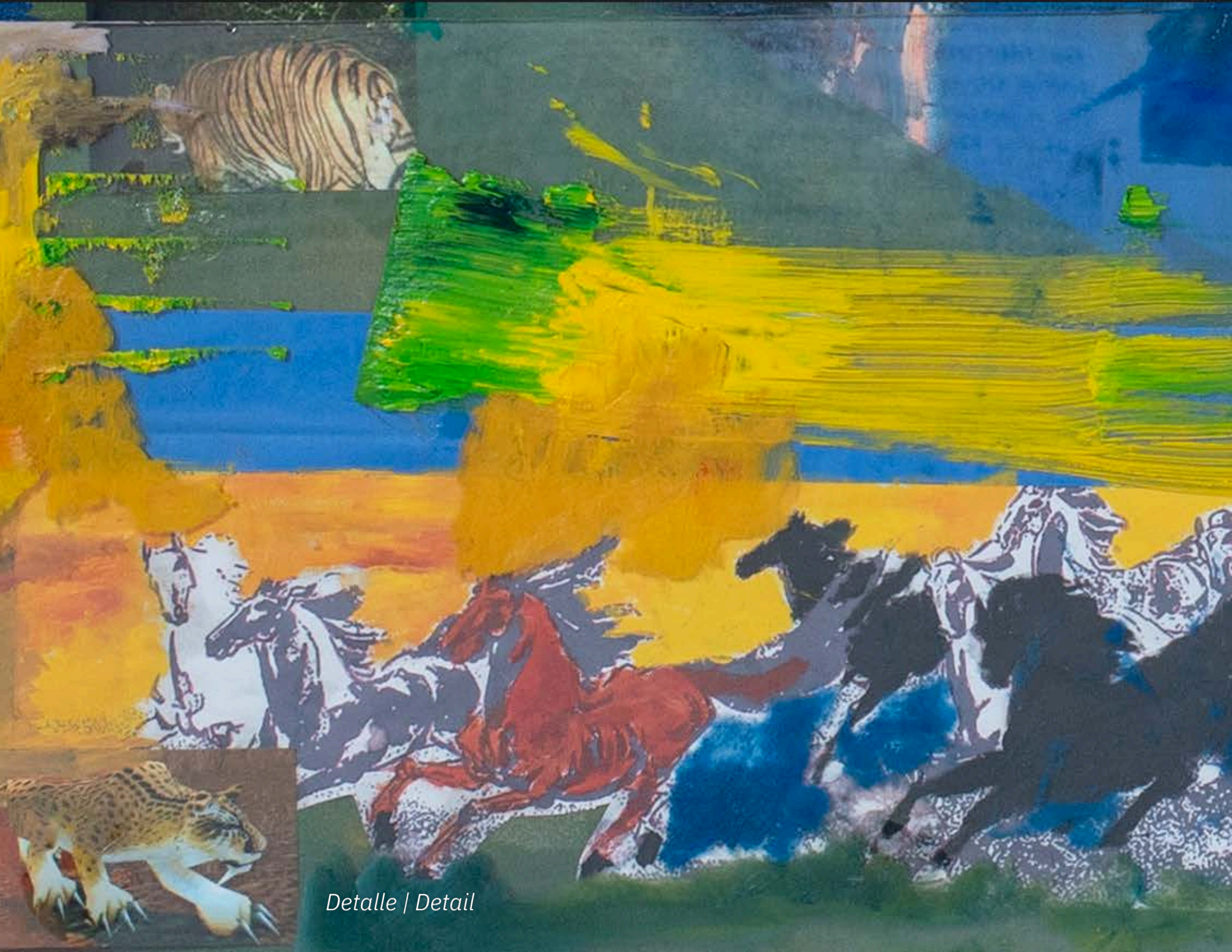
Detalle | Detail