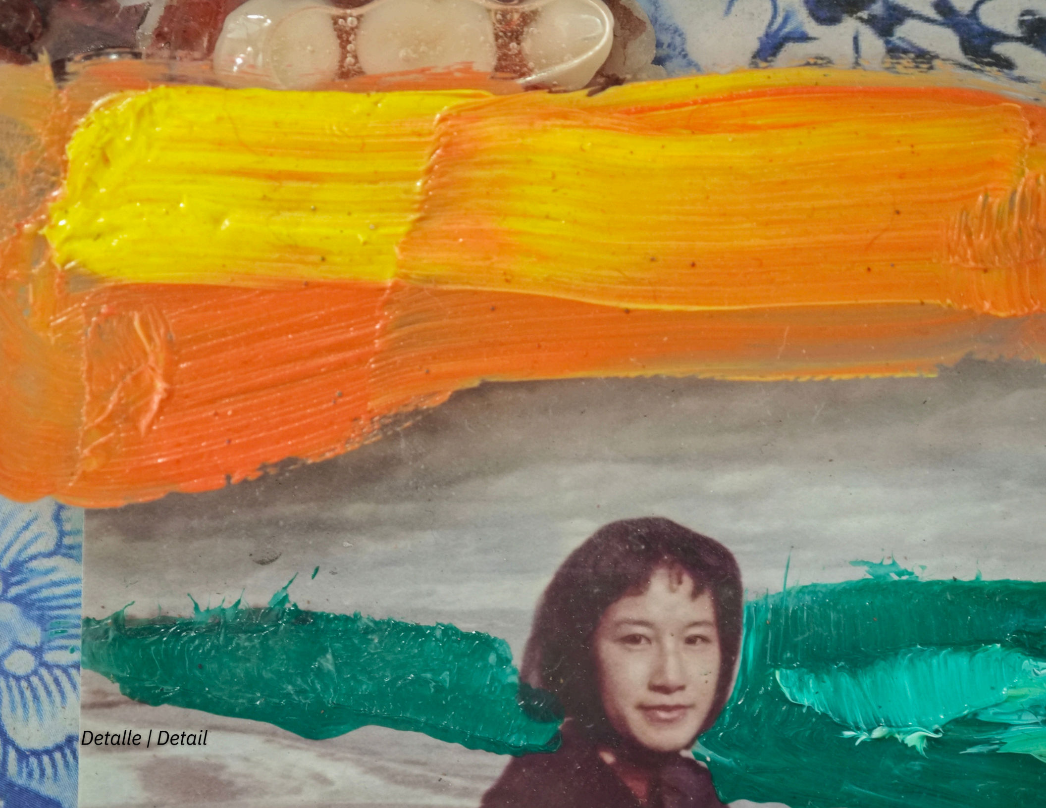
Detalle | Detail