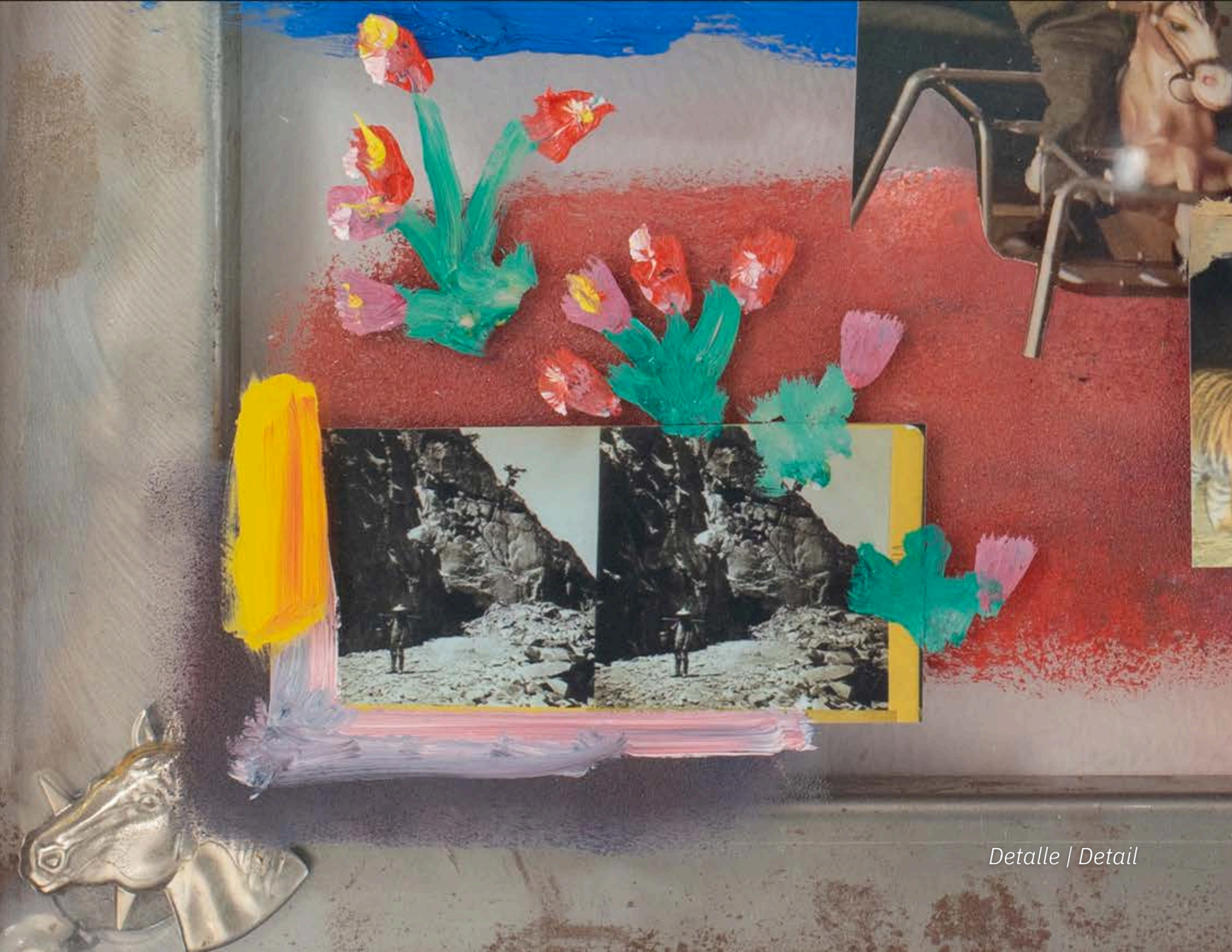
Detalle | Detail